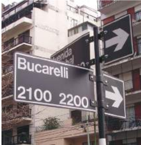
Avenida Bucarelli en Buenos Aires.

Posteriormente le fue encomendado desde la corte el salto al Nuevo Mundo donde brilló con luz propia, gobernando El Río de la Plata, como capitán general y presidente de la Real Audiencia de Buenos