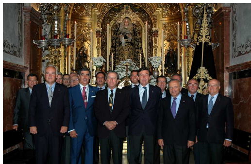
Caballeros maestrantes componentes de la nueva Junta de la Real Maestranza de Caballería y de la saliente.